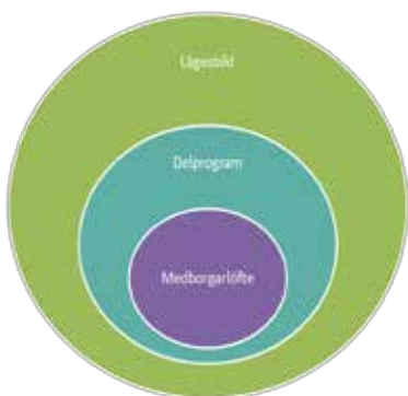
Figur 1: Definition Medborgarlöfte

För att förstärka samverkan ytterligare och som ett led i arbetet med demokratifrågor, kommer Jönköpings kommun och Lokalpolisområde Södra Vätterbygden enas om ett eller flera årliga Medborgarlöften. Dessa kommer att brytas ur något av delprogrammen som finns under ”Handlingsprogrammet trygghet och säkerhet”.