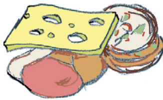
Ost och pålägg

Ta bort alla förpackningar runt ditt matavfall innan du slänger det. Allt avfall ska läggas i papperspåsen! Inget avfall får läggas löst i kärlet!