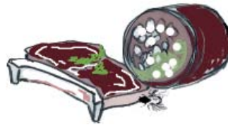
Kött och köttrens ej större än att det får plats i papperspåsen