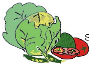
Skal och rester från grönsaker