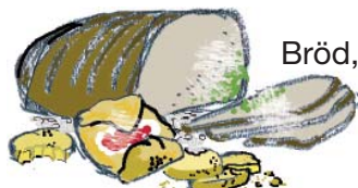
Bröd, kex och kakor