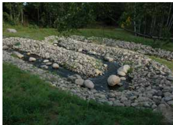
Omlöp, vandringsväg för fisk.

Attarpsdammen används för sportfiske. Nedanför dammen har en ny vandringsväg för fisken byggts, ett så kallat omlöp. Den stensatta fåran som slingrar upp i dammen, gör det möjligt för öringen att nå sina gamla lekplatser längre upp i ån och för öringungarna (smolten) att vandra ut i Vättern.