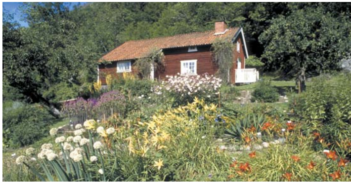
Brunstorps gård och trädgård erbjuder rikliga möjligheter till studier av kulturväxter och natur.