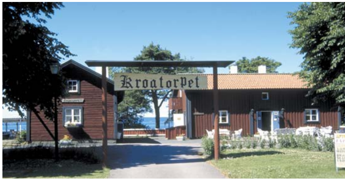
Kroatorpet uppfördes vid 1700-talets mitt på Rosendala gård. Hitflyttad 1951.

Brunstorps Gård und Garten bieten reichlich Gelegenheit zu Studien von Kulturgewächsen und Natur.