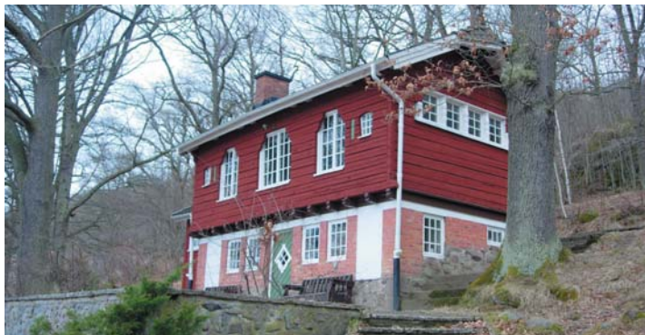
Stadsparksstugan byggd 1914 i Huskvarna stadspark.

Kroatorpet wurde Mitte des 18. Jahrhunderts auf dem Rosendala Gård errichtet. Hierher verlegt 1951.