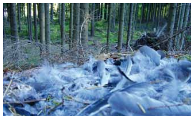
Både duvhök och omvårk finns i området. Fjädrarna är resterna av en slagen nötskrika