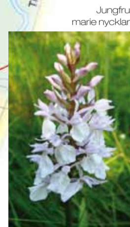
Jungfru marie nycklar