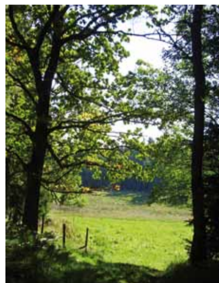
Åker söder om Bergkulla