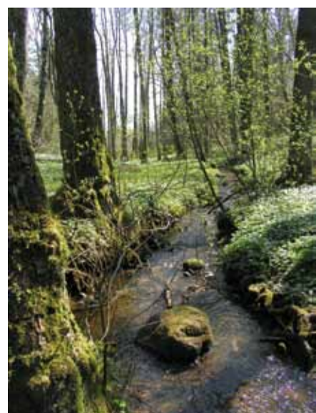
Junebäcken uppströms Åsendammen