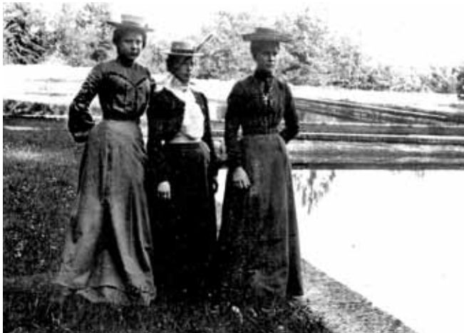
Tre damer på utflykt till Vattenledningsparken 1903

Åsenverket togs ur drift 1958. Tjugo år senare var dammarna förfallna och parken igenvuxen, vilket uppmärksammades av allmänheten och hembygdsföreningen. Jönköpings kommun beslutade att iordningsställa området som natur- och rekreationspark. Lagom till Jönköpings 700-årsjubileum 1984 var stigslingor röjda, fontänerna fungerade och utsikten återställd. På så sätt blev Vattenledningsparken och dess natursköna omgivning återigen en vedertagen del av Jönköpings friluftsområden och ett uppskattat besöksmål.