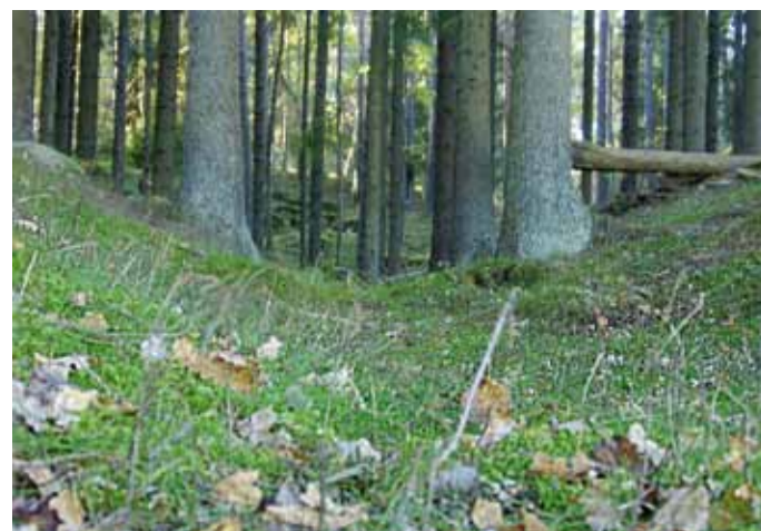
En s.k. hålväg löper genom området. Trampet av hästhovar och oxklövar, forna tiders transportmedel, har bildat en U-format skåra i marken

En av områdets största fördelar är dess tätortsnära läge. Det är nära till staden och många föreningar, skolor och förskolor besöker regelbundet området. Friluftsrådet har mulle- och strövarverksamhet. Åsendammen arrenderas av Sportsfiskeklubben. Jönköpings Södra IF har klubbstuga på Odensberg. June Hundklubb tränar i området. Flera stall finns på Hedenstorp och hästridning förekommer, särskilt i områdets södra del. Skolor och deras fritidsverksamhet är ofta vid Junebäcken.