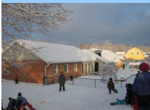
Förskolan Torps Ängar