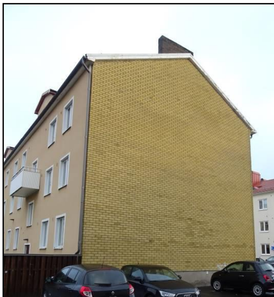
Gavel mot Drottninggatan

Idag är fasaderna förändrade genom en tilläggsisolering med spritputs som färgats i en ljusbrun kulör. Den norra gaveln har fått en gul tegelbeklädnad. Fönstren har fått markerade vita målade fönsteromfattningar.