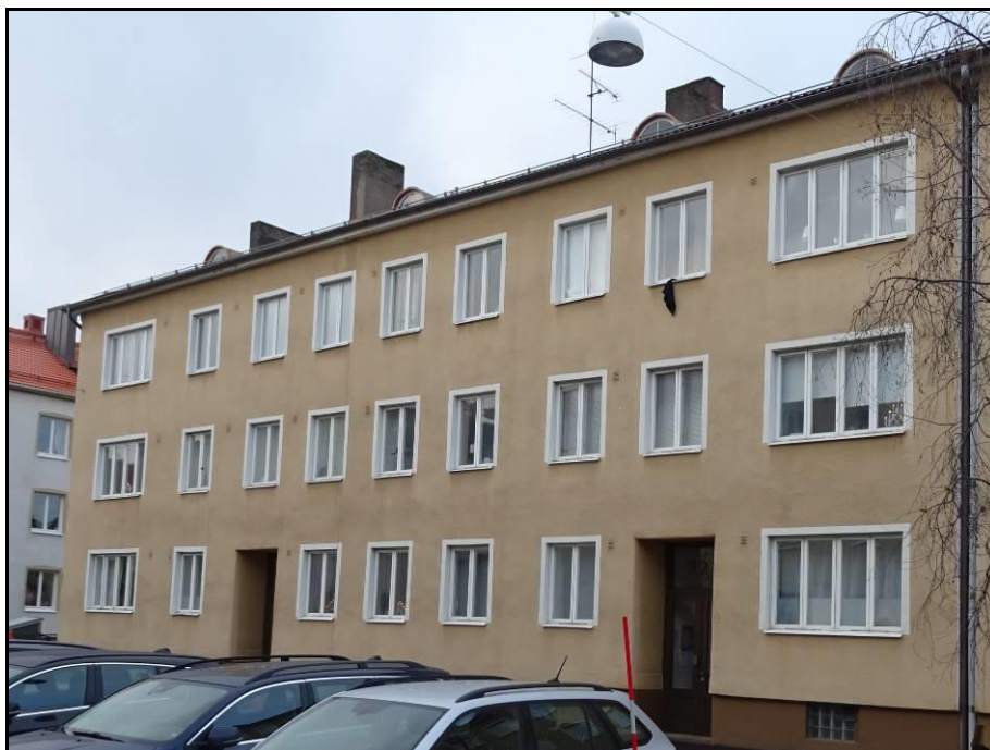
Fasad mot Brahegatan

Detta utlåtande avser fastigheten: Klubban 3 i Jönköpings kommun.