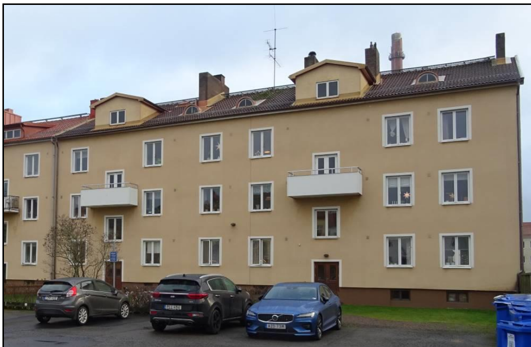
Fasad mot Berzeliigatan