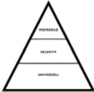
Figur 2 Preventionspyramid

En skyddsfaktor är något som ökar motståndskraften hos en individ. Här går det att särskilt peka på stabila och stödjande relationer inom och utom familjen och de egna egenskaperna. (Meltzer m.fl 2009, Martinez-Torteya m.fl 2009).