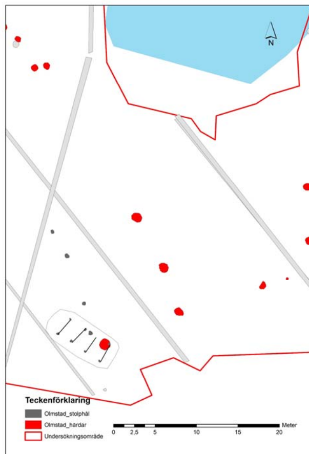
Fig. 3. Plan över Hus 2.

Om gavlarna, liksom vid Hus 1, placerats ca två meter i vardera riktningen var Hus 2 ca åtta m långt. Möjligen saknas stolphål i någon riktning, eller i båda, vilket gör att huset kan ha varit längre. Med antagandet att väggarna, liksom vid Hus 1, varit ca 1,4 m ut från de takbärande stolparna var husets ca fem m brett.