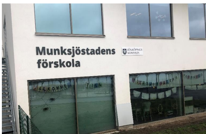
Figur 5. Exempel på fasadskylt i typsnittet Open Sans extrabold.

Typsnittet Open Sans ska användas. Den viktigaste informationen på skylten, nivå 2, skrivs i Open Sans med vikten extrabold i första hand. Nivå 3 och 4 skrivs ut i vikten semibold eller regular. Namn och texter skrivs versalgement för bästa läsbarhet. Kursiv text är svåräst ur tillgänglighetssynpunkt och ska inte användas. Taktila skyltar skrivs med versala bokstäver för att formen ska kunna urskiljas.