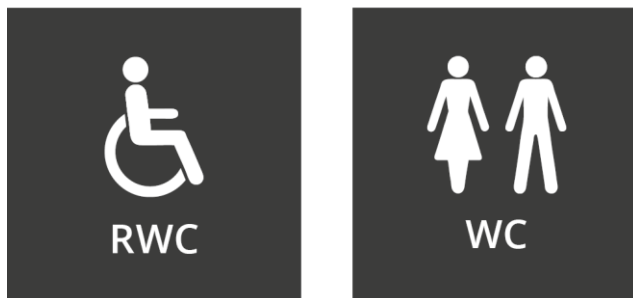
Figur 4. Exempel på skyltar med taktila pictogram och texter.

Punktskrift behöver inte användas, eftersom taktila bokstäver är tillgängligt för samt kan läsas av flera och därmed ersätter behovet av punktskrift.