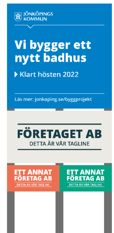
Figur 7. Principskiss vid skyltning av byggprojekt