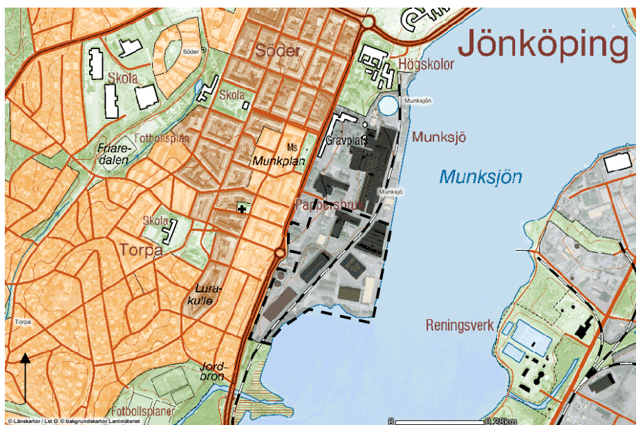
Figur 1. Översikt över Munksjö Paper AB:s verksamhetsområde i centrala Jönköping. Område aktuellt för exploatering är markerat. Beskrivning av verksamheten

Stora delar av det aktuella området har också blivit utfyllt under det att verksamheten vid fabriken vuxit. Enligt jordartskartan (SGU Ser. Ae nr 59. Jordartskartan 7 E Jönköping SV) gäller detta i princip hela markområdet öster om järnvägen (samt delar av Munksjön).