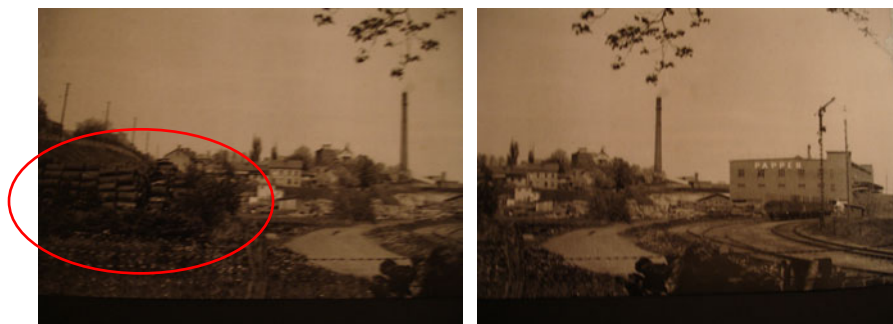
Figur 4. Foto taget söderifrån år 1950. På bilden syns ett förmodat upplag av tomfat (inringat) samt södergaveln på byggnad 134 (Munksjö museum).

Det har framkommit bilduppgifter på att det har förekommit någon form av upplagsverksamhet på den sydvästra delen av området, se figur 4 . Det går inte att, utifrån fotografiet, säga vad för slags upplag det handlar om, men det antas vara någon form av tomfat.