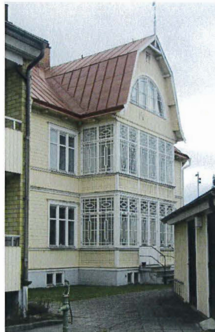
Fasad mot sydväst.