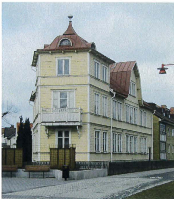
Byggnaden sedd från sydost.