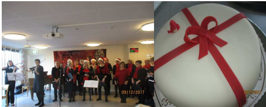
Kören After Work sjöng välkända julsånger.