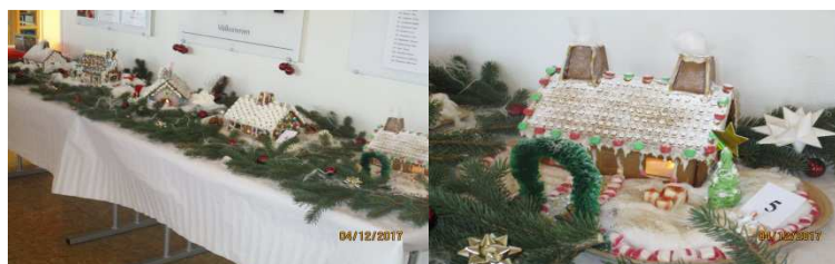
Vår årliga pepparkakstävling mellan enheterna är nu avgjord. Det blev nr 5, Solrosen, som vann. Hyresgäster och personal har gjort ortroliga fina pepparkakshus det var 203 personer som har röstat.