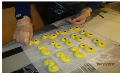
Tillsammans har vi bakat goda lussekatter som vi avnjöt med en kopp kaffe.