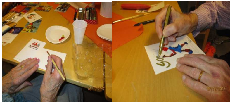
Några hyresgäster har målat fina julkort.