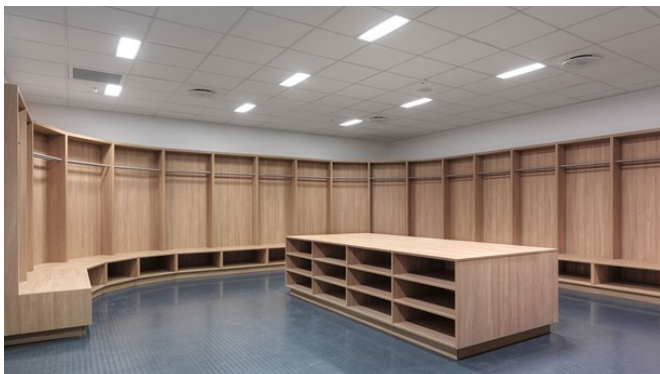
Bild: exempel på lösning i omklädningsrum

Sekundärur för tidvisning. Plats för taktiktavla.