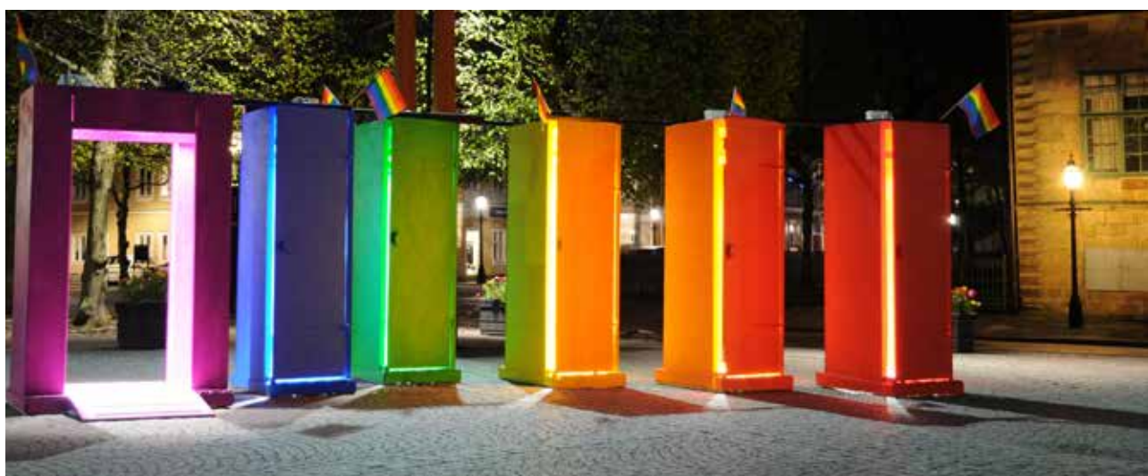
Belysta färgglada garderober på Hovrättstorget i samband med Qom Ut-festivalen.