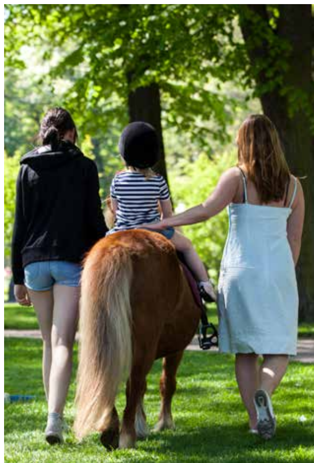
Vissa evenemang passar att ha i kommunens parker.

Kvällsekonomi syftar till att skapa och tillhandahålla ett brett, tillgängligt och flexibelt utbud som gör att fler människor i större utsträckning nyttjar stadskärnan kvällstid. Kvällsekonomin syftar även till att skapa trygga, levande och attraktiva stadskärnor med stadskvaliteter.