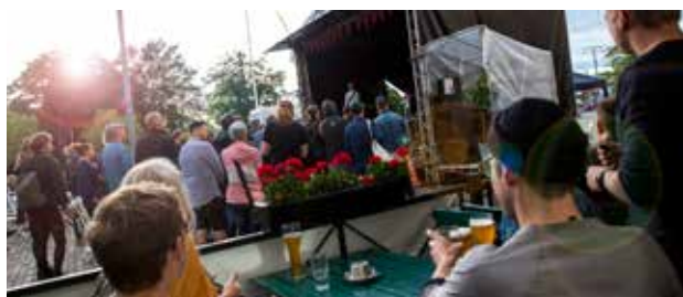
Sommaronsdagar är ett exempel på evenemang som ska positivt överraska besökaren i stadskärnan.

För att ytterligare förtydliga och förenkla för externa intressenter ska Jönköpings kommun utveckla en eventlotsfunktion, som hjälper arrangörer att hitta rätt i kommunens organisation gällande frågor som eventytor, tillgänglighet, säkerhet, finansiering och städning m.m.