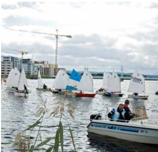
Jönköpings kommun har många vackra blå kvaliteter som också är möjliga evenemangsytor.

Vid större evenemang kan det eventuellt behövas trafikomläggningar. Då är det viktigt att planeringen för detta görs i god tid i samverkan med Jönköpings kommun. Arrangören behöver då upprätta en så kallad Trafikanordningsplan samt att se till att det finns trafikvakter vid behov.