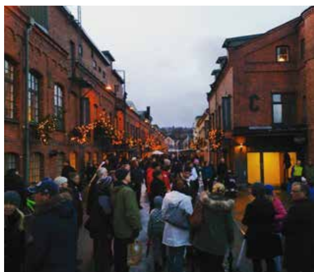
Ibland kan det vara lämpligt att skapa kvartersvisa utvecklingsgrupper som gemensamt samlar resurser och skapar unika evenemang.

En attraktiv stadsmiljö är varierad och föränderlig, där det ena kvarteret inte är det andra likt. Ett sätt att förbättra chanserna att uppnå detta mål är att ibland skapa kvartersvisa utvecklingsgrupper. Det kan t.ex. vara alla verksamheter runt ett torg eller längs en gata som gemensamt samlar resurser och skapar unika evenemang. Grupperna kan då bestå av bland annat kommunrepresentanter, butiker, restauranger, arrangörer och fastighetsägare.