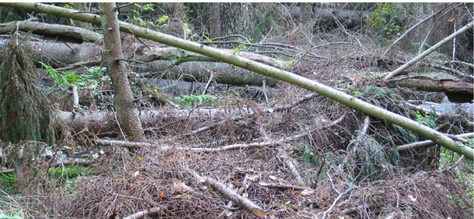
Strömsbergsskogen efter stormen Gudrun.