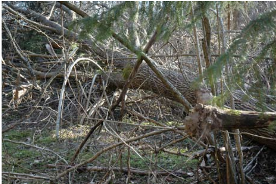
Strömsbergsskogen efter stormen Per.

Kunskapen om förväntade klimatförändringar och dess konsekvenser är för närvarande ofullständig och ett stort behov av kunskapsuppbyggnad finns därför. Jönköpings kommun ser dock ett behov av att redan idag inleda det angelägna arbetet med att vidta klimatanpassningsåtgärder, i synnerhet vid planering av ny verksamhet. Följande klimatplaneringsförutsättningar skall därför tills vidare gälla för all kommunal verksamhet.