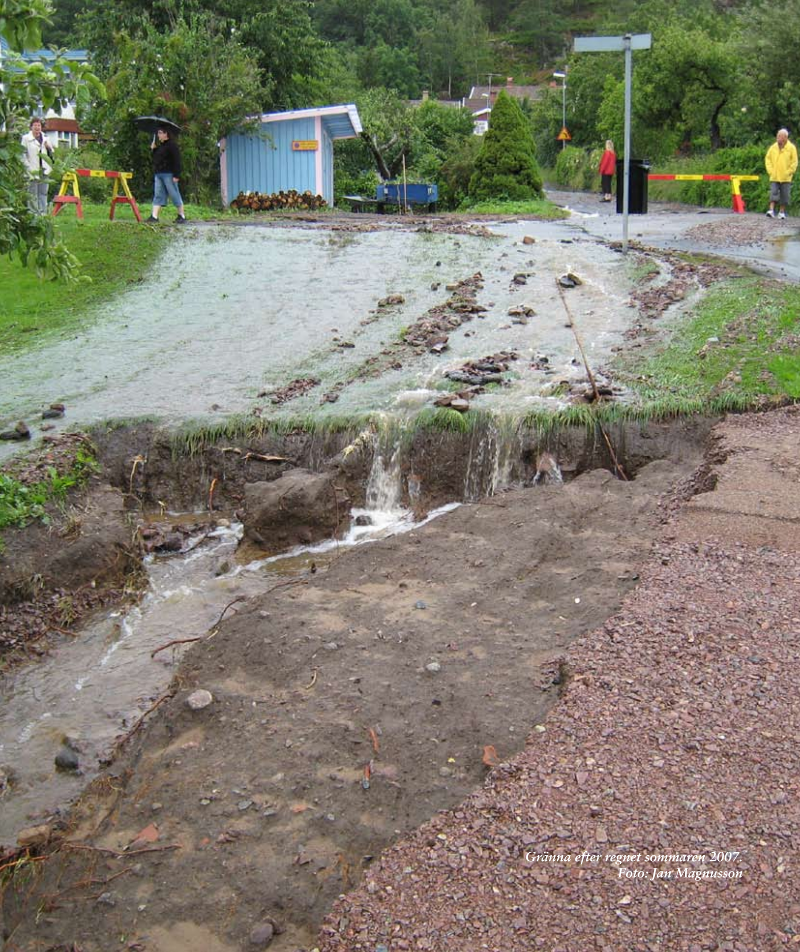
Gränna efter regnet sommaren 2007.