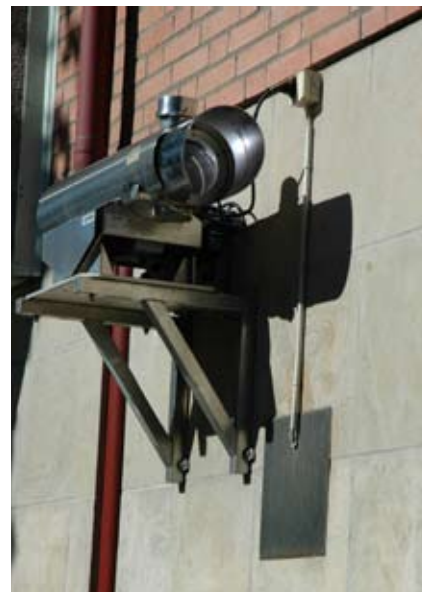
Kungsgatan i Jönköping. När man mäter föroreningar i luften kan man använda sig av att olika föroreningar absorberar ljus vid speciella våglängder. Ett ljus skickas ut och en mottagare läser av hur mycket ljus som tas emot.

senaste istiden för ca 12 000 år sedan. I framtiden förväntas klimatet bli alltmer instabilt. Stora temperaturskillnader skapar ökad turbulens i atmosfären som ökar både stormfrekvens och intensitet. Det är inte heller säkert att vårt framtida klimat följer en linjär utveckling. Istället finns en risk att atmosfären och klimatet kan drabbas av tröskeeffekter som leder till snabba klimatförändringar 5 både i form av en skenande uppvärmning eller det omvända. Bevis för sådana händelser finns från både geologiska och historiska tider. Exempel på händelser som skulle kunna orsaka en snabb omkastning till betydligt kallare klimat för vår del är en förändring av Golfströmmen, stoft från ett större vulkanutbrott eller ett större meteoritnedslag.