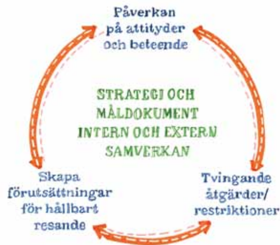
Figur 2: Planer och verksamhet för "hållbart resande" måste samordnas med övrig kommunal verksamhet, och utformas så att den tydligt bidrar till kommunens övergripande utvecklingsmål (figuren visar ett exempel på samordning).