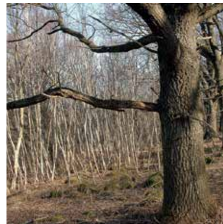
Gråalsdjungel före restaureringen