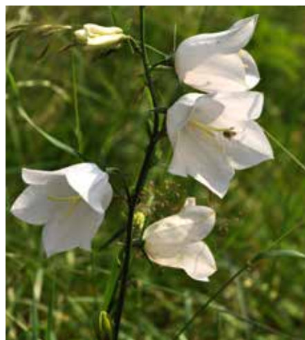
Vit variant av stor blålocka