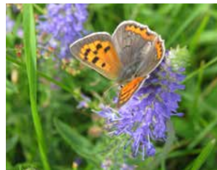
Axveronika med mindre guldvinge