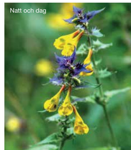
Natt och dag