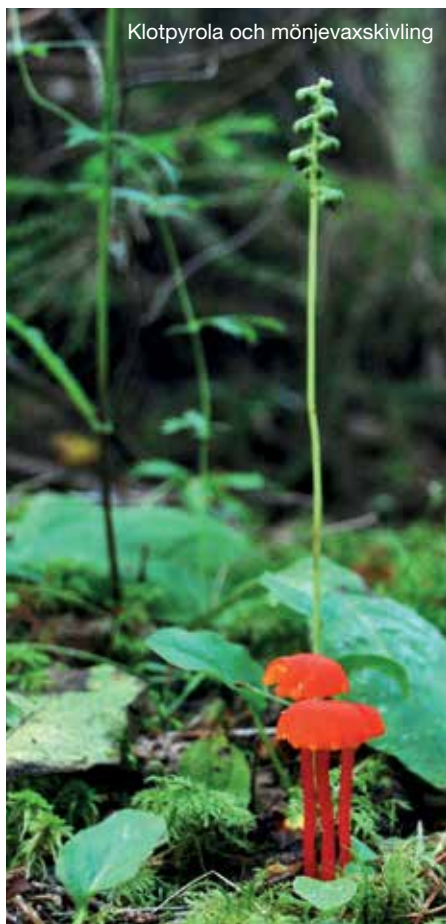
Klotpyrola och mönjevaxskivling

PARKERING: En mindre P-plats och en informationsskylt finns centralt i området vid vägen som passerar förbi.