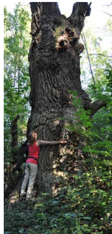
Vasaeken är en av Jönköpings största