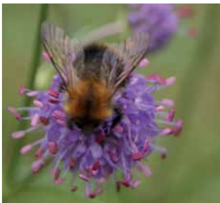
Hushumla på ängsvädd

BUSS: Mot Borås. I Bottnaryd gå 1,5 km västerut på gamla landsvägen. Det finns också en hållplats Löcknevägen 200 meter från Prostataallen. Följ gångcykelvägen under väg 40.