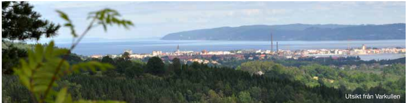
Utsikt från Varkullen

BUSS: Till hållplats Hovslättsrondellen eller Huluäng. Från hållplats Huluäng går man 600 m genom bostadsområdet Huluäng västerut till Åsafors och Kallebäcksleden.