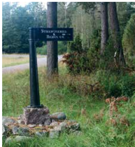
Gamla Mulserydsvägen i Ryd