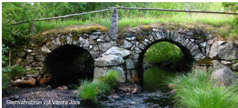
Stenvalvsbron vid Västra Jära