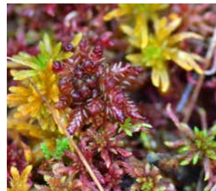
Olika arter av vitmossor