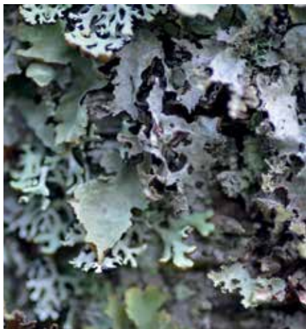
Näverlav och blåslav