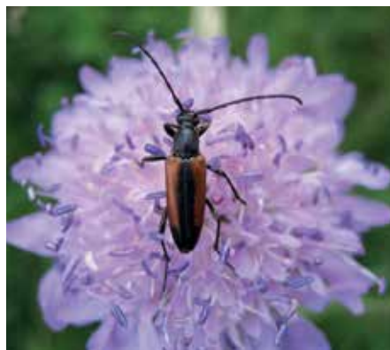
Ängsblombeck på åkervädd

På andra sidan järnvägen finns grova ekar och en god tillgång på död ved. I områdets norra del förekommer dessutom en mycket grov tall.