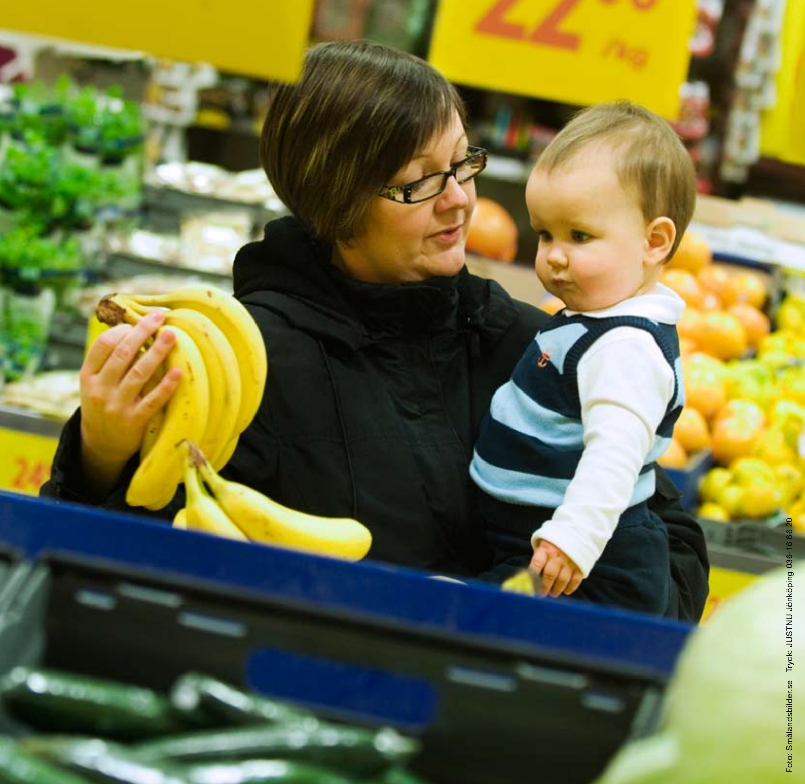
Tryck: JUSTNU Jönköping 036-16 66 20

STADSKONTORET Handelsstrategi för detaljhandeln i Jönköpings kommun inom ramen för Stadsbyggnadsvision 2.0 www.jonkoping.se/stadsbyggnadsvisionen