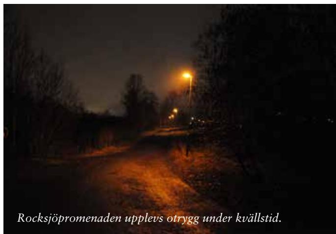
Rocksjöpromenaden upplevs otrygg under kvällstid.