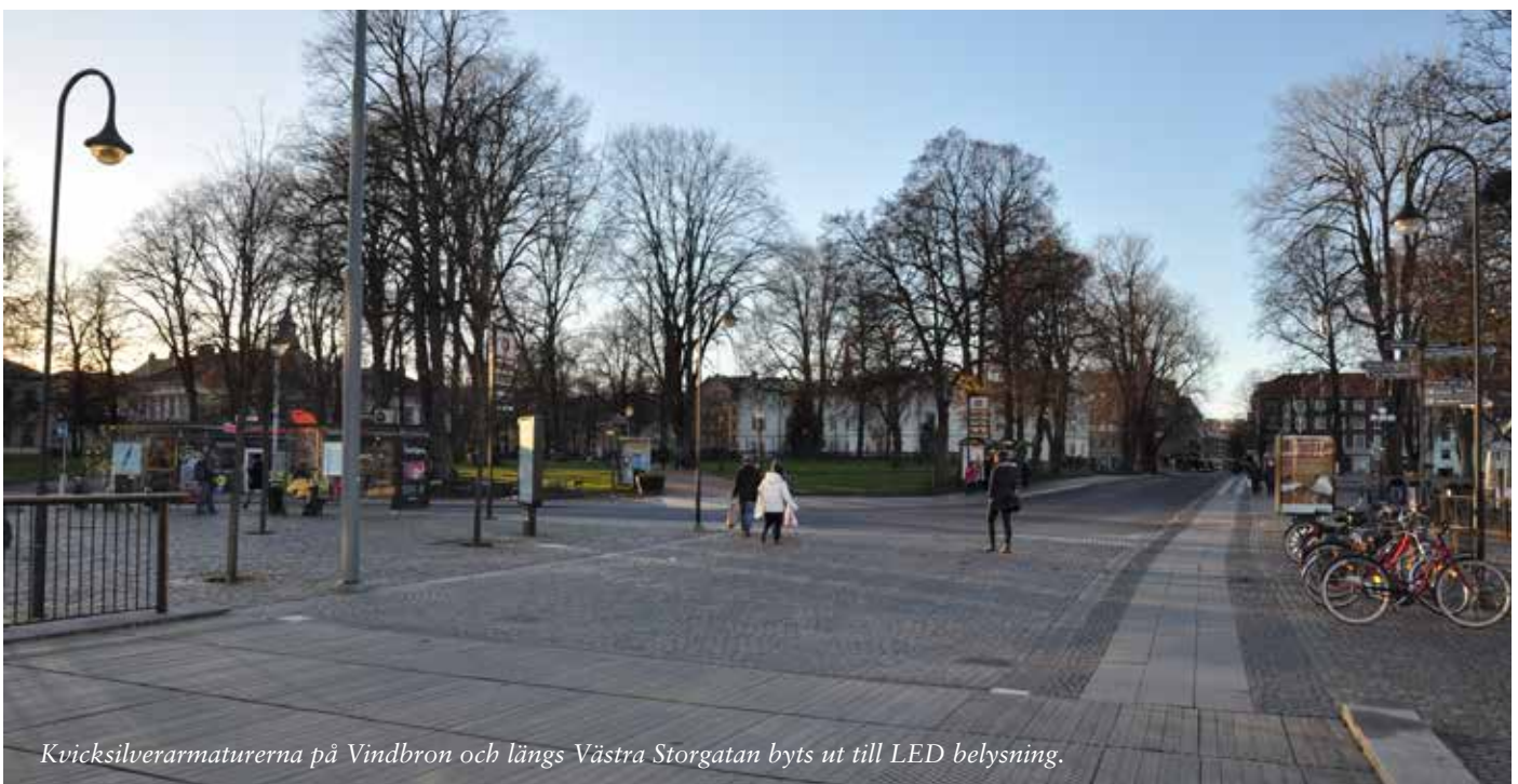
Kvicksilverarmaturerna på Vindbron och längs Västra Storgatan byts ut till LED belysning.