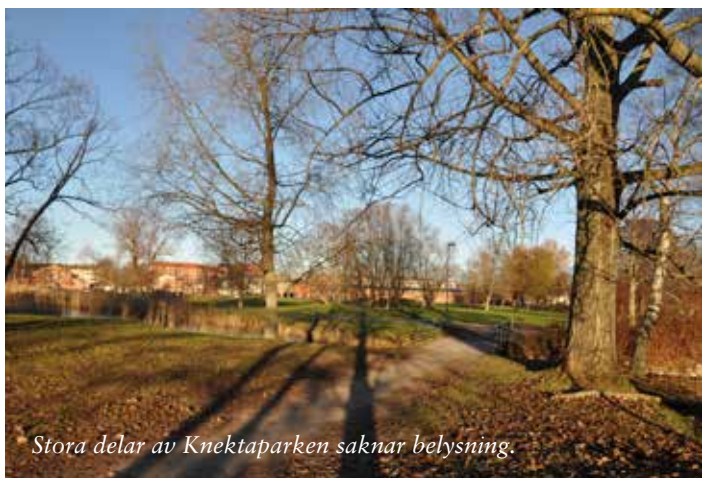
Stora delar av Knektaparken saknar belysning.

Försök med ett intelligent styrsystem för att ytterligare minimera energianvändningen lämpar sig väl på detta projekt.