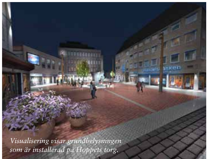
Visualisering visar grundbelysningen som är installerad på Hoppets torg.

Armaturer för att till exempel skapa färgat ljus med mönster installeras. Dessa gestaltningar kommer att kunna sparas men också programmeras om. Vilket gör det möjligt för externa ljusdesigners, konstnärer, studenter med fler att laborera med ljus mitt i stadskärnan. Kanske i samband med de inslag av musik och kulturliv som stadens liv och innehåll erbjuder?