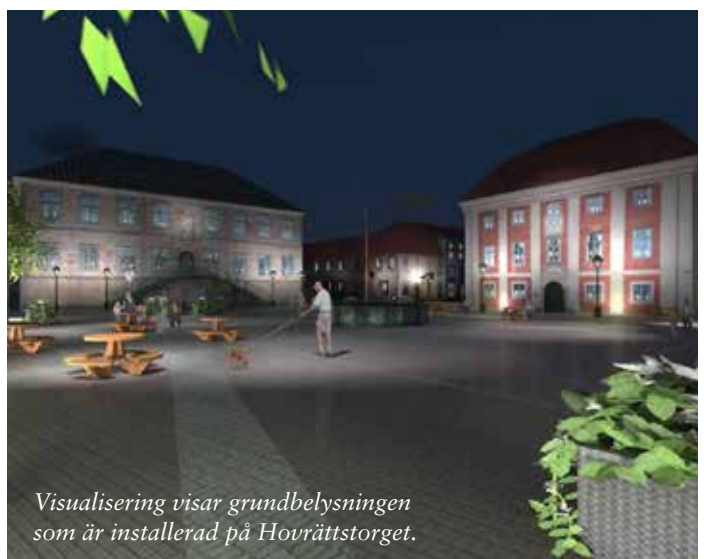
Visualisering visar grundbelysningen som är installerad på Hovrättstorget.