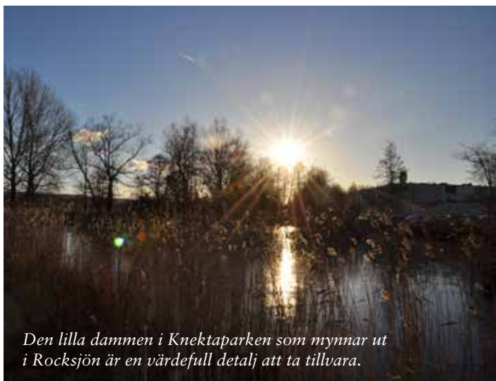
Den lilla dammen i Knektaparken som mynnar ut i Rocksjön är en värdefull detalj att ta tillvara.