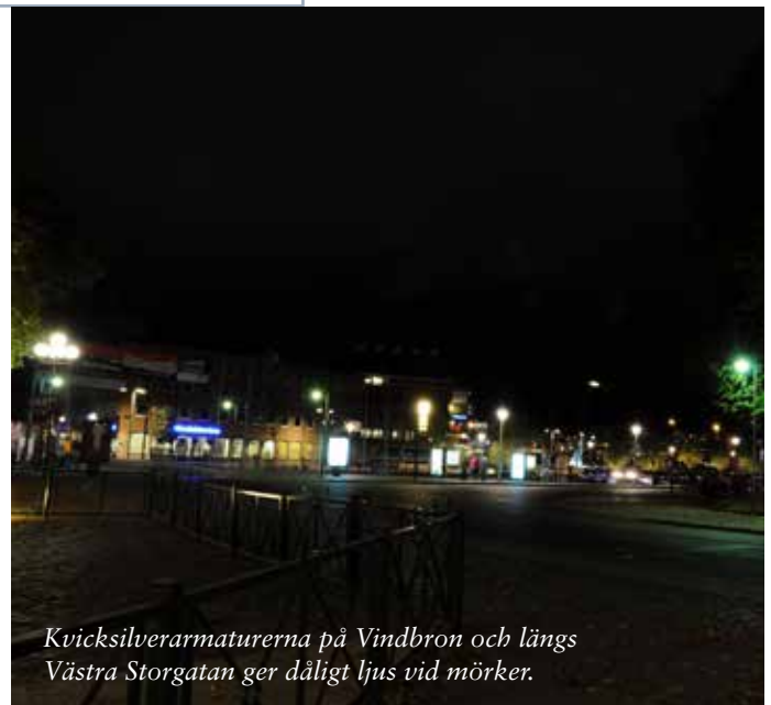
Kvicksilverarmaturerna på Vindbron och längs Västra Storgatan ger dåligt ljus vid mörker.

Belysningen ska också syfta till att vara attraktiv och skapa rumskänsla genom att markera Vindbron och Västra storgatan med riktat ljus ner mot marken och på vertikala ytor i en väl harmoniserad ljusnivå. Stor vikt ska läggas på armaturens utförande för att få en väl avskärmd ljuskälla, placerad på lämplig höjd och riktad så att den inte bländar.