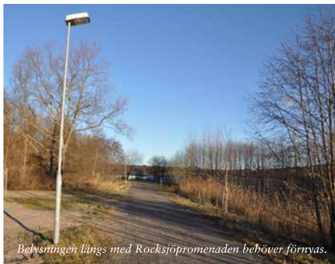
Belysningen längs med Rocksjöpromenaden behöver förnyas.