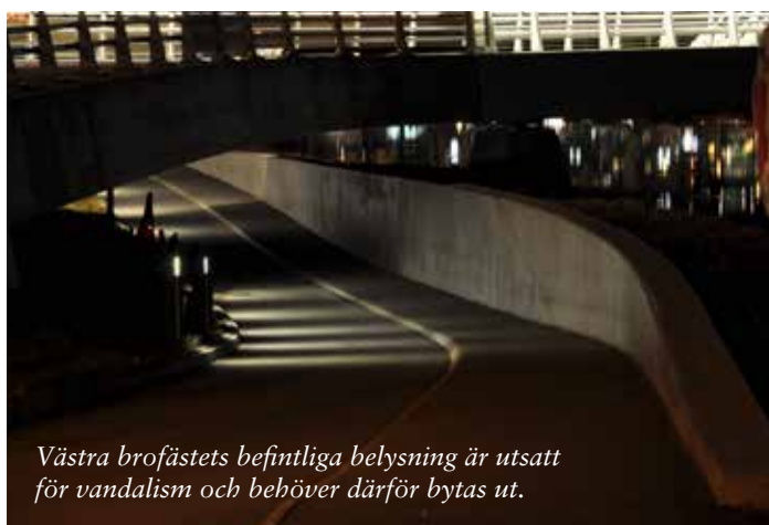
Västra brofästets befintliga belysning är utsatt för vandalism och behöver därför bytas ut.

Brofästena på Munksjöns båda sidor är portar mellan olika områden i stadskärnan. De ingår i huvudnätet för gång- och cykelstråk i staden. På västra sidan sammanbinds bland annat högskolan med Västra kajen. På den östra sidan kommer brofästet vara en viktig länk mellan Östra kajen och Spira. Dessa väl utnyttjade stråk ska med hjälp av belysning ge platserna ett lyft ur en trygghetssynpunkt. Genom att gestalta brofästena med spännande, föränderlig och dynamisk ljussättning förhöjs känslan och kopplingen till denna kreativa och kulturella plats.